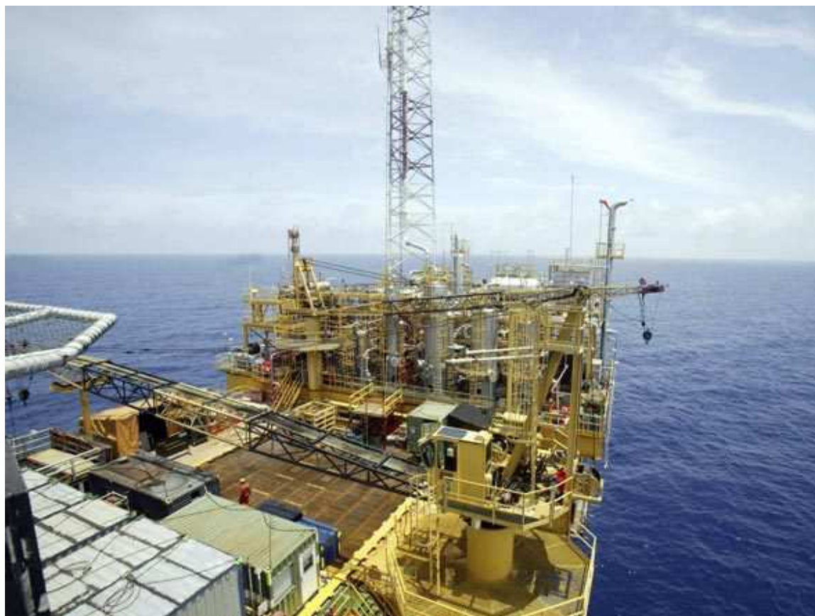
Plataforma da Petrobras na Bacia de Santos